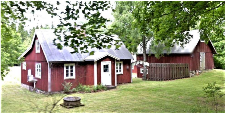
Sågetorp, Tågarp 1:21 i Verums socken. Bild från juni 2011.

Ingress till bouppteckning efter grosshandlaren Anders Lundgren upprättad 1857-11-20