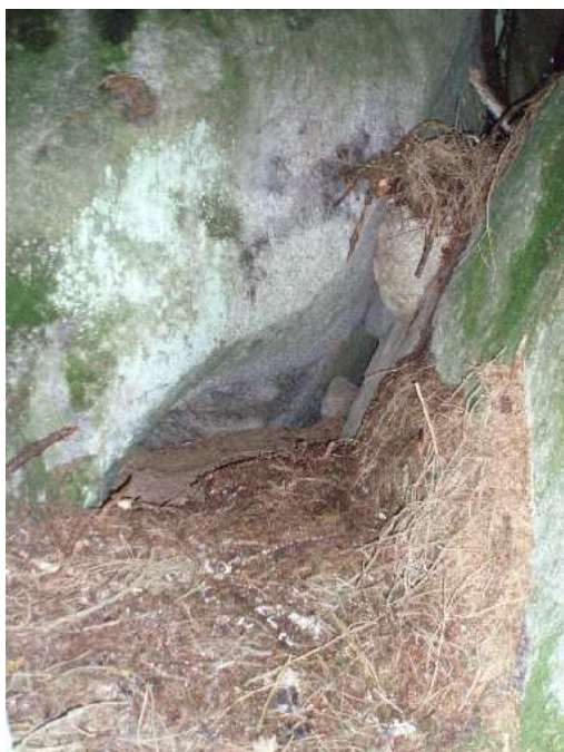
Bild 7: Den omskrivna grottan?