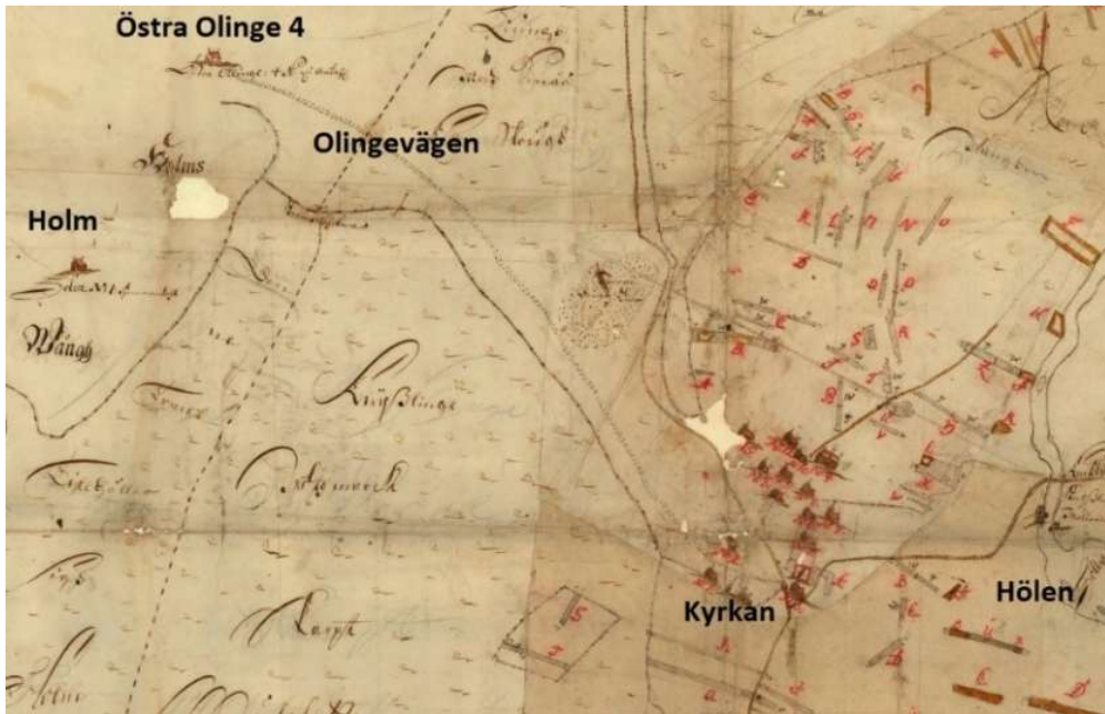
Bild 1: Karta över Knislinge 1696. (Ursprungskartan från Lantmäteriets historiska arkiv, artikelförfattarens tillägg.)