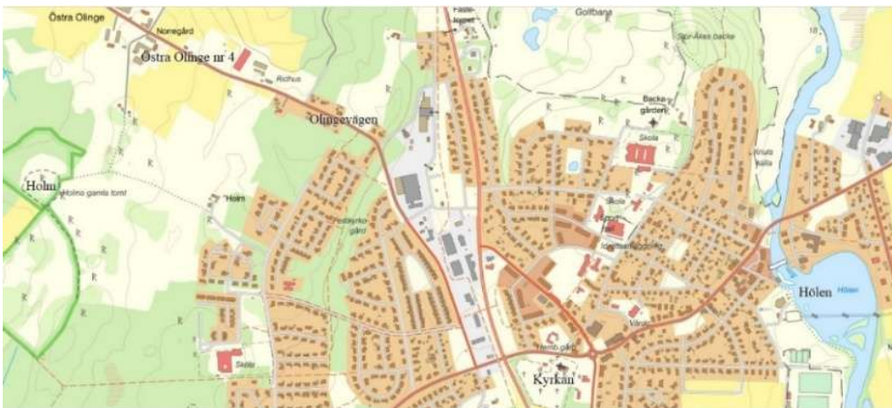
Bild 2: Karta över Knislinge 2025. (Ursprungskartan från eniro.se, artikelförfattarens tillägg.)