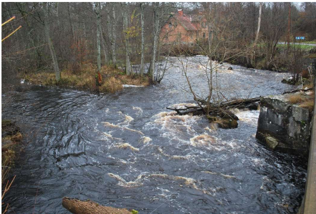
Bild 4: Den forsande Almaån vid Spånga.