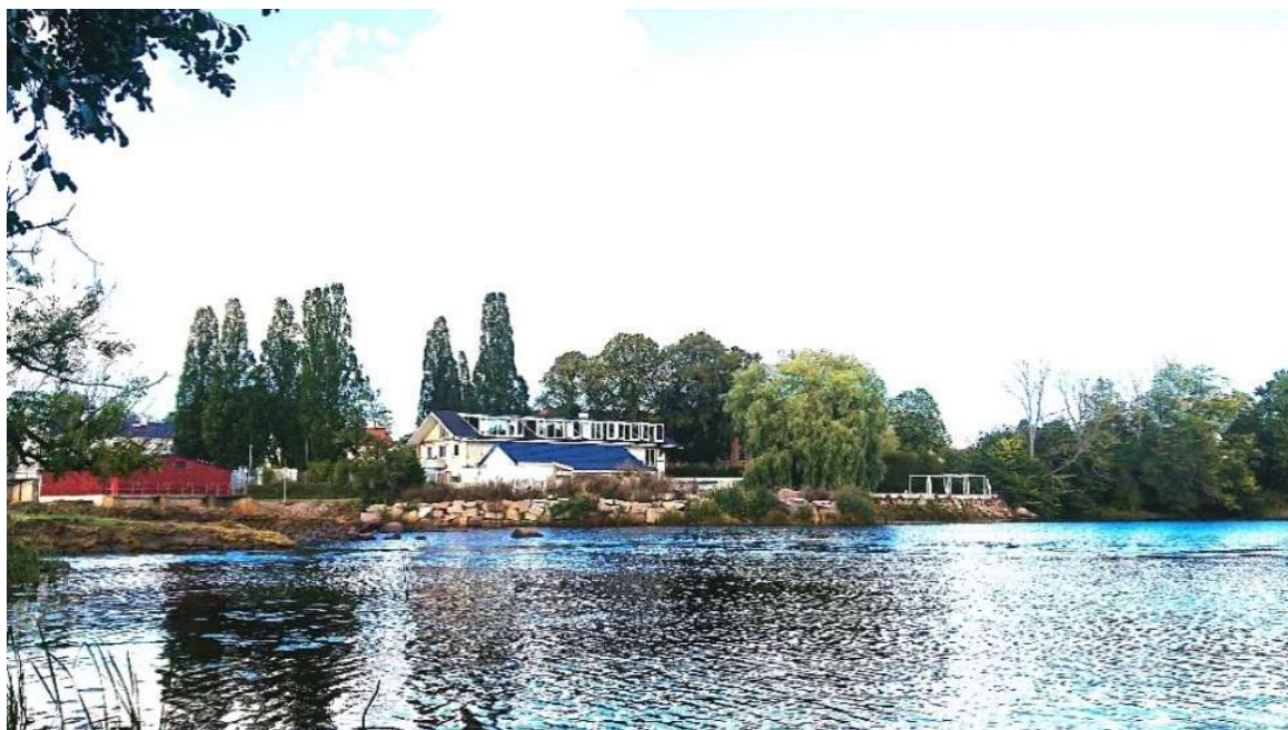
Bild 3: Här stod Helgehus. Från vänster syns kraftverket, gamla mejeriet och skofabriken som kan anas bakom träden.

Vad beträffar industrierna i närheten av bron är ett par av byggnaderna rivna medan till exempel skofabriken och mejeriet numera hyser företag och lägenheter. Gatunamnen Mejerigatan, Lejongatan (Lejonskor) och Anitagatan (Anitastrumpan, Strumpfabriken byggd 1930) minner dock om tidigare verksamheter. Dagens kraftverk uppfördes 2014 på samma plats och med tegel återanvänt från sin föregångare från år 1925 som inledningsvis uppfördes för att ge ström åt skofabriken.